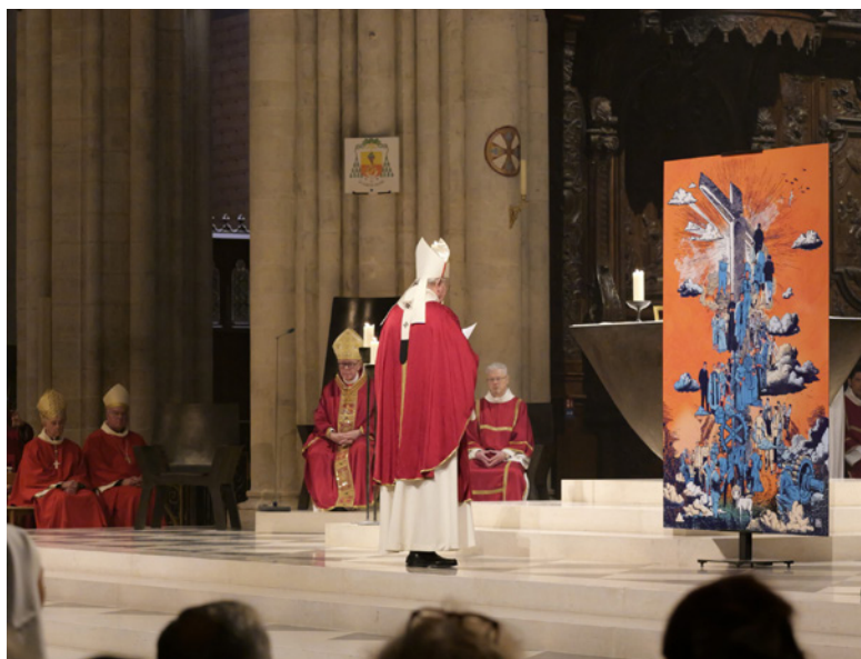
Messe de béatification de cinquante martyrs de l'apostolat.